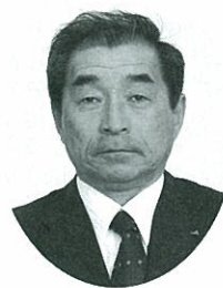
美唄市農業協同組合