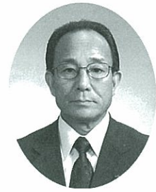
美唄市農業協同組合