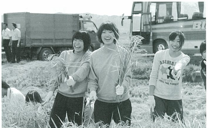
(写真 鎌と稲を手に収穫を楽しむ教育大学生)

今回も中村共同施設利用組合の組合員のお手伝いを頂き、稲刈りを実習した。学生は圃場で、鎌を使った刈