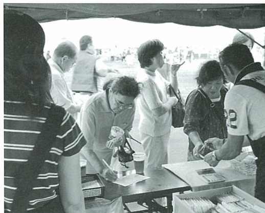
(写真 無料試飲、アンケート調査を行う風景)

9月5日、美唄産ハスカップを使った「ル美ール」を農道空港で開催された百万凧まつりに、無料で振る舞い、多くの市民で賑わった。試飲をした20代女性は「とてもみやすい！ビールとは思わなかった」また、購入について聞いてみると「手頃に飲めるしビールというよりカクテル感覚で飲める」という声が多かった。