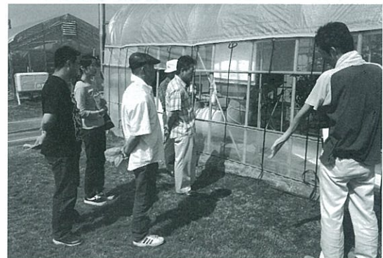
高設イチゴ生産者による 花野菜技術センターの地熱冷房施設視察 H23.7.13