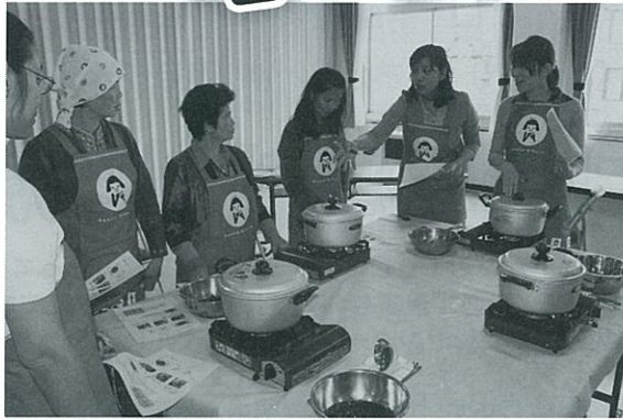
タイ農業女性来道視察研修 H23.6.23