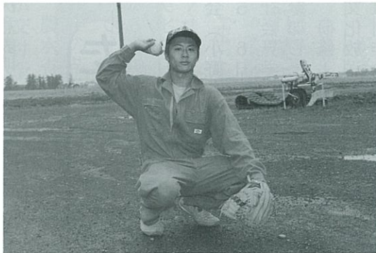
(野球で捕手をやっている)

知識をどんどん吸収していきたいと考えています。夏には上美唄センターで無人ヘリコプターでの防除作業に使ってもらって、何かとお世話になっていきます。まだまだケツの青い自分ですが、経験を生かし、安全・信用と共にお互いを助け合いながら頑張っていきたいと思えます。