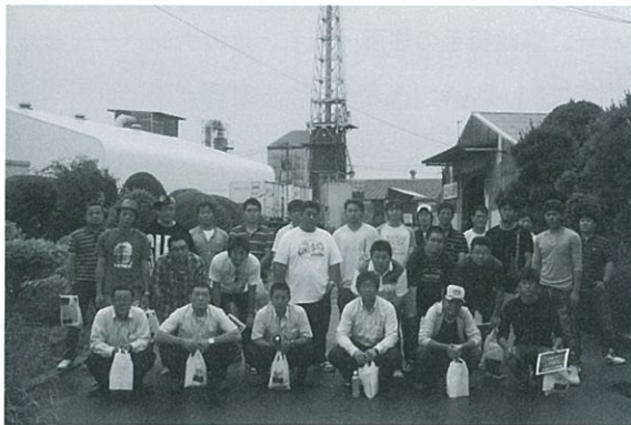
青年部部員研修 北海道日産化学(株)を視察 H23.7.7