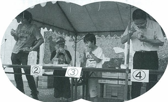
Aコープコア店謝恩ビール祭り H23.7.8