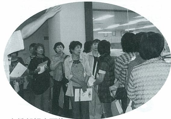
女性部視察研修 北海道赤十字血液センターを視察 H23.7.8