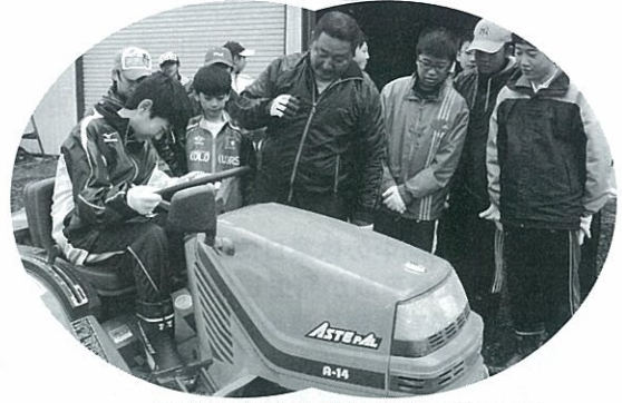
美唄中学校農業体験 H23.6.24