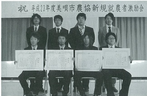
(新規就農をする8名)

新たに就農した若者達を激励する為、6月17日に「平成23年度美唄市農協新規就農者激励会」を開催した。就農者や来賓、関係者ら30名が出席した。今年度の新規就農者は、新規学卒が4名とUターンが4名の計8名。18歳から32歳の水稲中心の農業後継者で、来賓や地域の事業推進員が農業を担う仲間