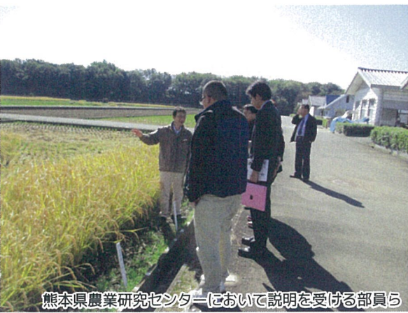
熊本県農業研究センターにおいて説明を受ける部員ら