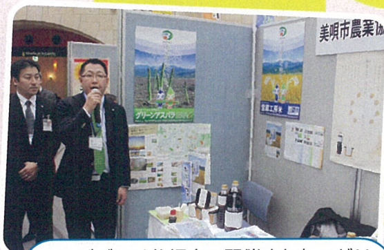
J Aびばいは札幌市で開催されたアグリビジネス創出フェアに参加し、昨年2月に発売された《びばいのてしごとしょうゆ・みそ》などをPRした。(11/28)