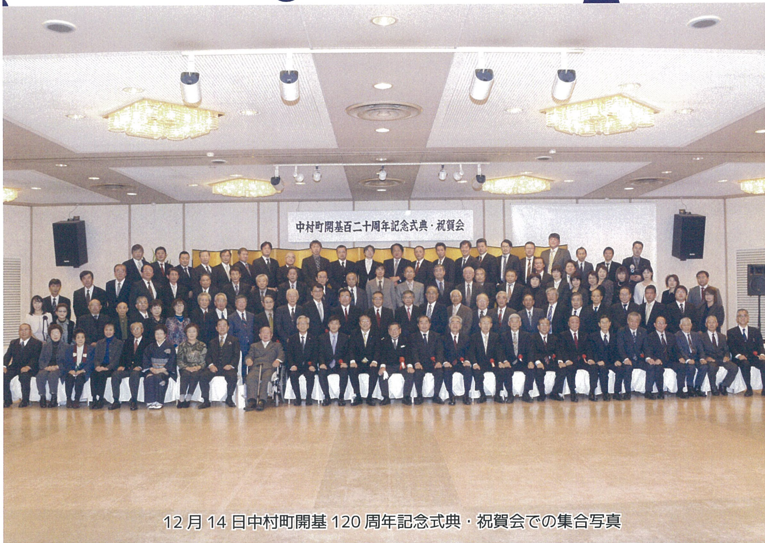
12月14日中村町開基120周年記念式典・祝賀会での集合写真