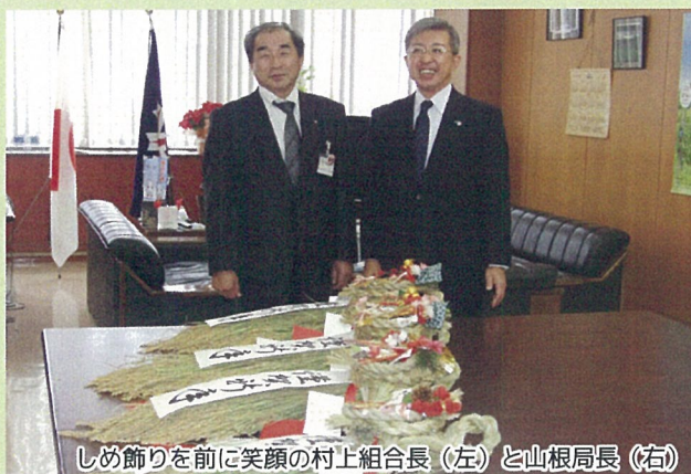
しめ飾りを前に笑顔の村上組合長(左)と山根局長(右)