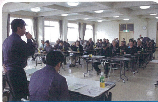
J Aびばいは3階会議室において経営所得安定対策の見直し等に係る説明会を美唄市と合同で開催し、約50名の組合員が出席した。(11/27)