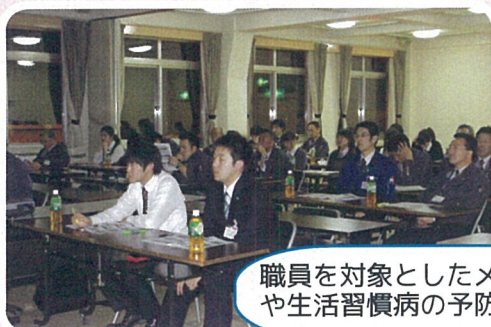
職員を対象としたメンタルヘルス研修会が開催され、ストレスパターンのチェックや生活習慣病の予防方法などについて学んだ。(12/12)