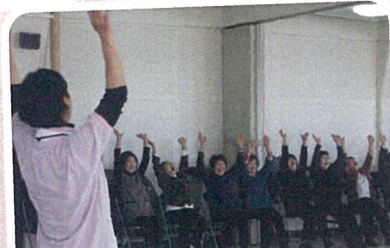
毎年恒例シルバー部会のクリスマス会は美唄市社会福祉協議会の方を講師に招き、ゲームや食事を楽しみました。(12/16)

女性部三役は「タオル一本運動」として養護老人ホームの恵風園に、未使用タオルや古着、毛糸などの他、段ボール5箱分を寄贈しました。(12/8)