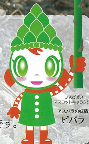
JAびばい マスコットキャラクター アスパラの妖精 ピパラ