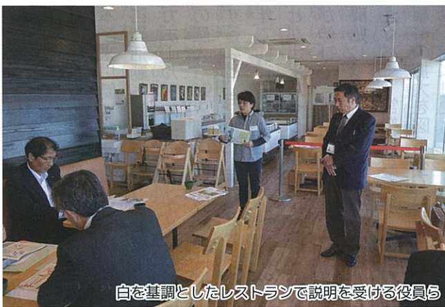
自を基調としたレストランで説明を受ける役員ら

して仕入れ、レシピは地元大学教授から指導を受け、管理栄養士も常駐。海の見えるレストランで健康と伝統をテーマとした食の魅力を味わえました。商品の仕入れは委託(JA関連農畜産物)と買取(漁協)の2種類。地元生産者の募集(現在184名)や利潤確保に苦心もあるようです。農地が少なく生産量も少ないため、生産者自身の農産物を販売するという意識が低く、同マルシェを通じて生産物を販売し生産意欲が高まった生産者も増えたようです。気候は温暖で果樹や園芸作物など多様な生産物の集荷は可能ですが、生産量が少なく安定供給が今後の課題と考えます。