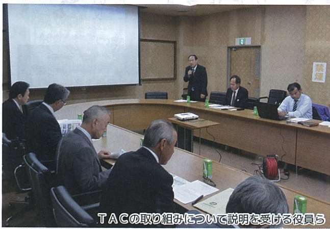
T A C の取組について説明を受ける役員ら

専任部署として経済部営農企画課が担当し、人員はT A C 担当2名、営農経済渉外員4名が配置されています。T A C 担当職員は1人あたり75件を担当し、各戸とも毎月1回以上は訪問すること以外は数値目標等を