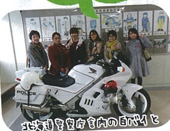
北海道警察庁内の自バイレ