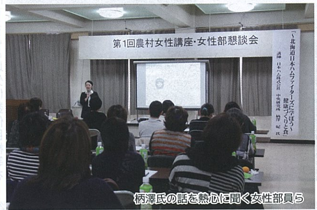
柄澤氏の話に熱心に聞く女性部員ら