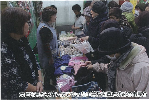
女性部員が丹精込めて作った手芸品を買い求める市民ら

会場には、女性部員らが手作りした手芸品やしめ縄が並んだほか、加工部会のみそを使った豚汁や新米おにぎりなどが訪れた市民に振る舞われた。