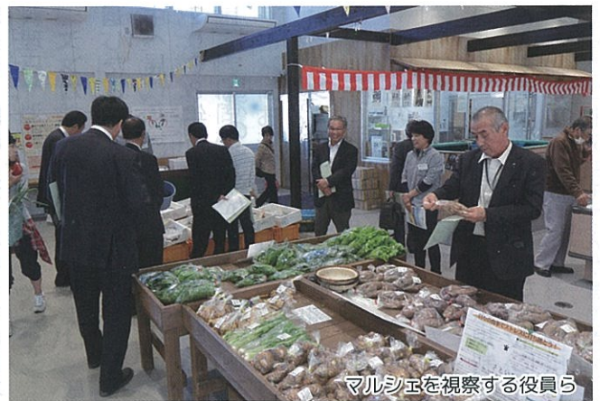
マルシェを視察する役員ら

鳥羽市が建物を提供し、鳥羽志摩農業協同組合と鳥羽磯部漁業協同組合が協同出資で設立した有限責任事業組合「鳥羽マルシェ有限責任事業組合」が運営する農水産物直売所と地産ビュッフェレストランで平成26年10月にオープン。立地する佐田浜地区はJR参宮線が終着し、鳥羽駅と国道42号線に隣接。有人離島4島へ定期航路が離発着する鳥羽マリンターミナルにも位置していることから、市民や観光客にとって交通の利便性が高く、市内の各地域を結び起点としては最適な場所といえます。