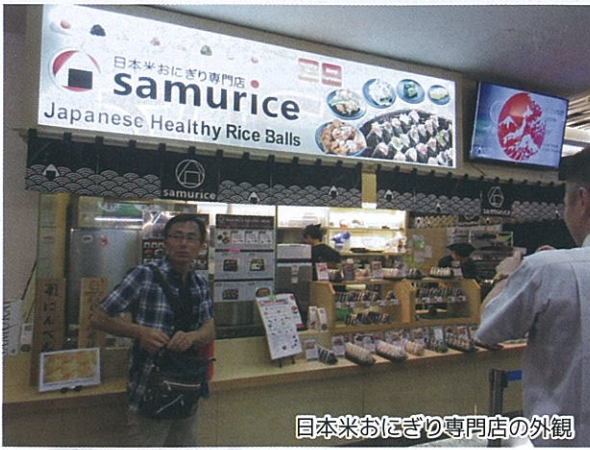
日本米おにぎり専門店の外観

店内1階は、20人ほどの椅子席があり、日本の定食屋の雰囲気が出されています。ランチメニューは定食類やカレー類、天ぷらやカツなど丼物が豊富で、1,500円前後の価格帯でしたが、総じて物価が高いシンガポールではリーズナブルな日本食店との事。白飯自体は少し固めに感じましたが、日本で食べる「ななつぼし」と遜色なく頂けました。夜