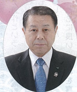
北海道農業協同組合中央会