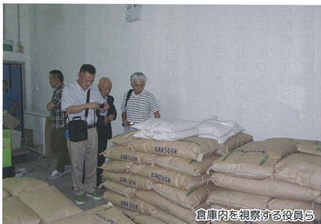
倉庫内を視察する役員ら

（2015年産米は「ななつぼし」よりも「あきたこまち」が1,000円/60kg程安価で推移している）