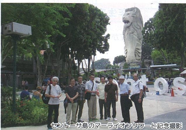
セントーサ島のマーライオンタワーと記念撮影