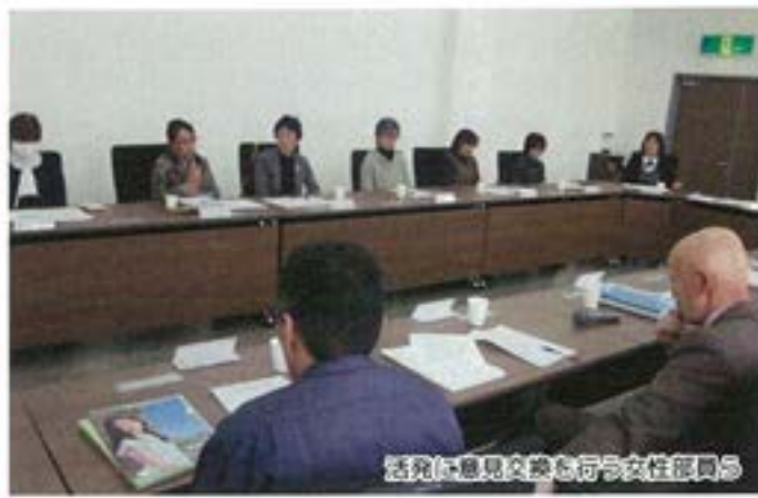
役員に意見交換も行う女性部員ら

女性部員らからの意見や要望はAコープに対するものが多かった。また役員らからも女性役員の配置についてや今後の女性部活動への激励の声が聞こえた。