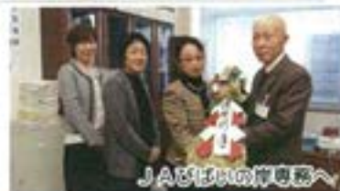
JAびばいの岸恵恵へ

今年も部員手作り「亀のしめ飾り」をJAや美眼市、ケアハウスハーモニーに寄贈しました。昨年同様、心のこもった手作りのしめ飾りにとても感動されていました。