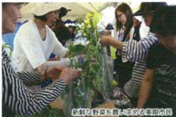
新鮮な野菜を買い求める美眼市民

真っ青な秋めいた空の下、市民と生産者(女性部)の交流会は長く続いていくことと願います。