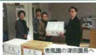
恵風園の津田園長へ

女性部員の皆様よりお預かりした未使用のタオルを、恵風園に寄贈させて頂きました。タオルはいくらあっても足りないとのことで、とても喜んでくれました。園の人たちの手で使いやすい大きさに切って利用するとのことでした。