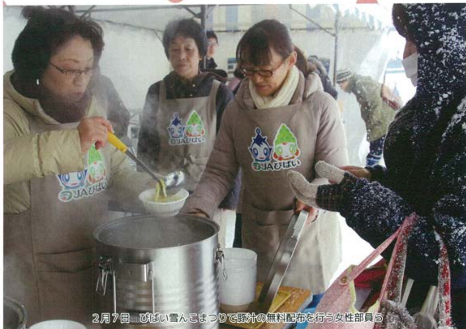
2月7日 びばい雪んこまつりで豚汁の無料配布を行う女性部員ら