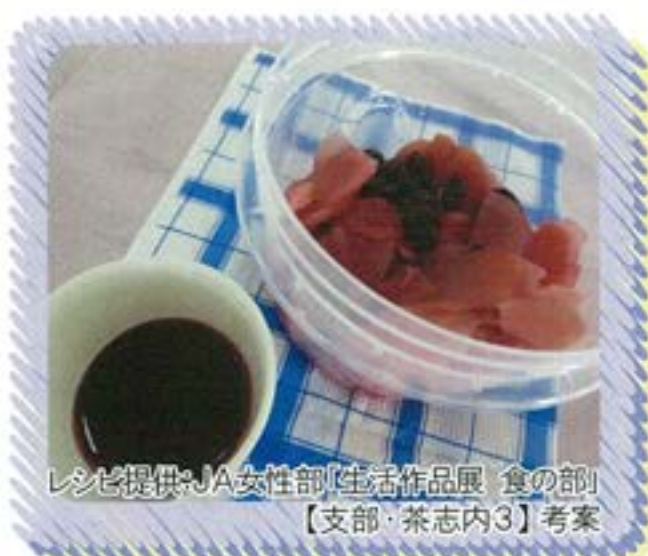
レシピ提供: JA女性部「生活作品展 食の部」 【支部・茶志内3】考案