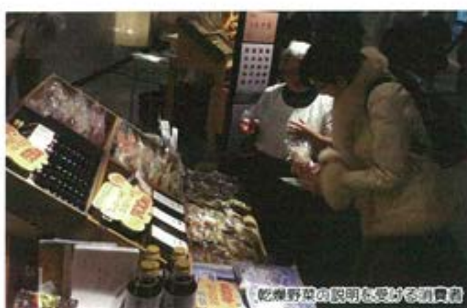
乾燥野菜の良さを伝える消費者

クラシエは毎回テーマを設けており、今回のテーマ「豆な暮らし」にちなんで、美幌市で作った大豆を使った味噌や醤油を販売した。また、開発町のつむぎ屋もともに出店し、乾燥野菜の魅力も市民らに広めた。