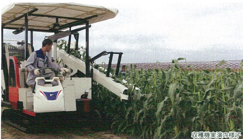
収穫機実演の様子