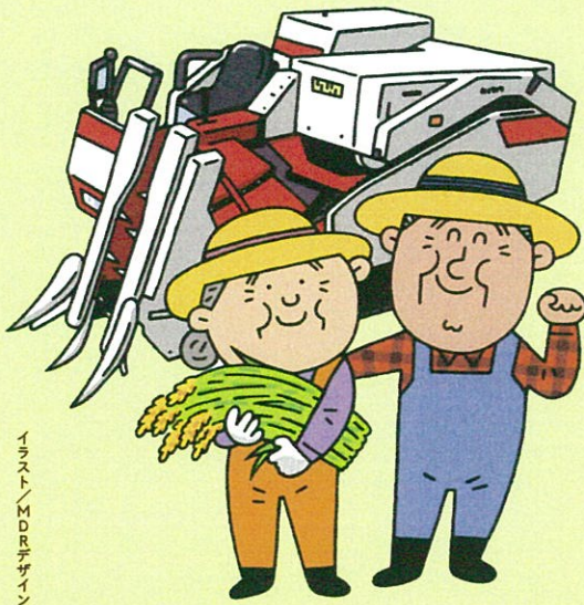
イラスト/MDRデザイン事務所