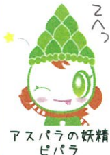
アスパラの妖精 ピバラ