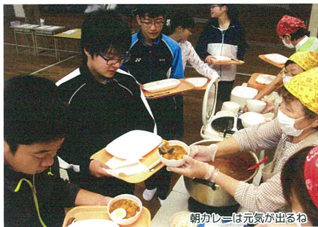
朝カレーは元気が出るね