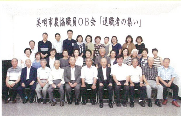
美唄市農協職員OB会「退職者の集い」をJAの3階中会議室で開催し、31名の退職者らが2年ぶりに顔を揃えた。会場では思い出話に花が咲き、当時を懐かしむ声で大いに賑わった。(8/3)