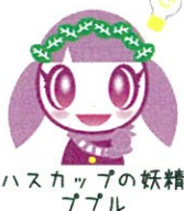
ハスカップの妖精 プル