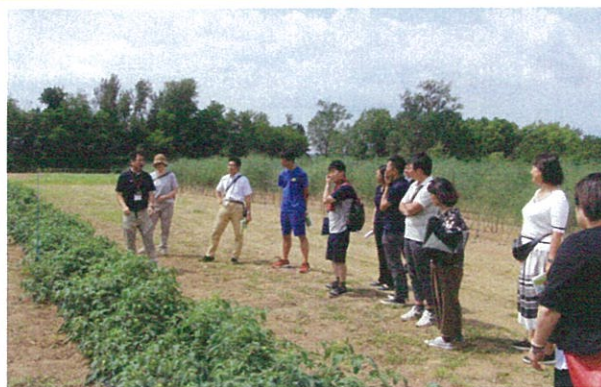
美唄市教育委員会が主催のふるさと美唄研修会を開催。農業を美唄市の基幹産業と位置づけ、教育活動に活かしていくことを目的に市内の教職員らが参加。JAの農場や選果場を見学した。(8/1)