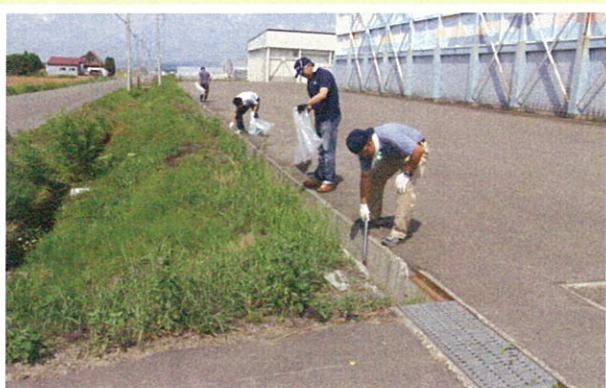
JAの職員組合が2回目となる施設周辺清掃を実施。28名の職員らが参加し、本所事務所のほからいす工房などの施設でゴミを拾い歩いた。清掃活動終了後は懇親会を開催し、職員間の交流を深めた。(8/3)