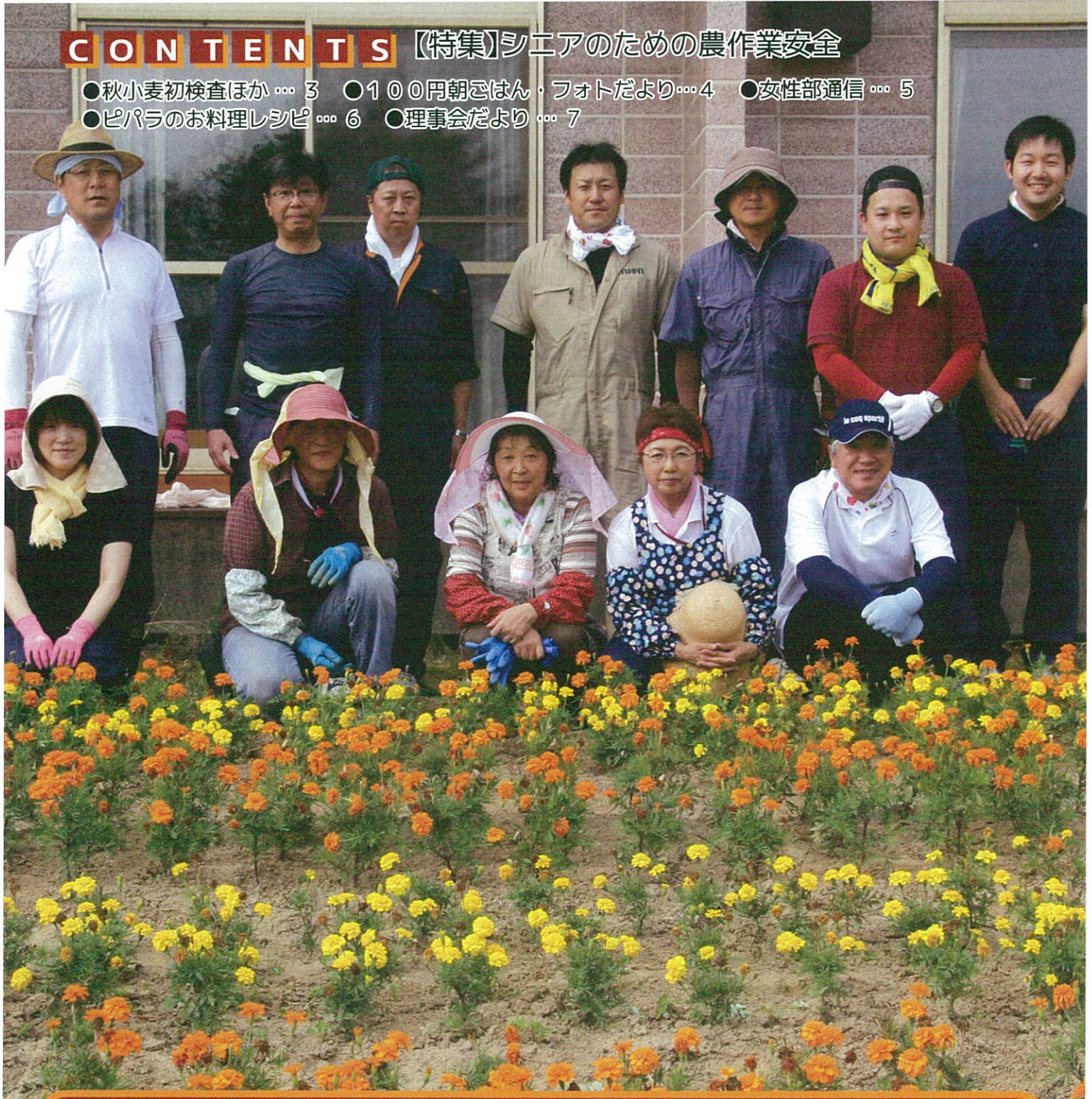
8/7 茶志内3連合会の花壇除草に出向く事業（絆）体制の10名が参加