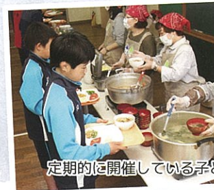
定期的に関催している子供