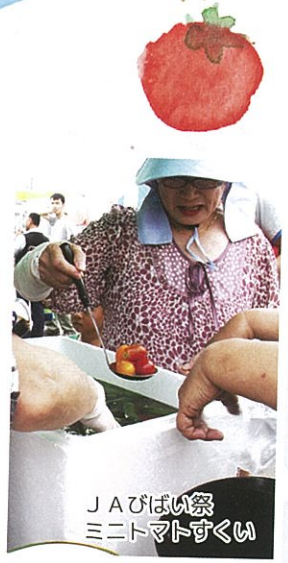
JAびばい祭 ミニトマトすくい