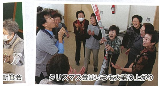
朝食会 クリスマス会はいつも大盛り上がり