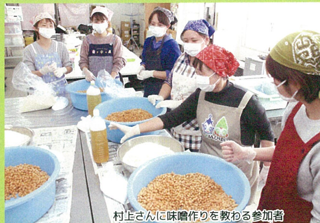
村上さんに味噌作りを教わる参加者

同部会では部会員増加につながるよう、活動する際は未入会で同年代の奥さんたちにも声をかけている。この日も部会員4名のほか3名の未入会者が参加し、味噌の仕込を体験した。今後は6月に切り返し作業を行い、1月に仕上がった味噌を参加者に配布する。