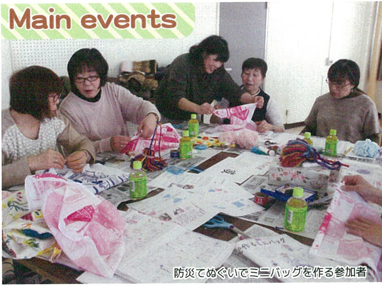
防災てぬぐいでミニバッグを作る参加者