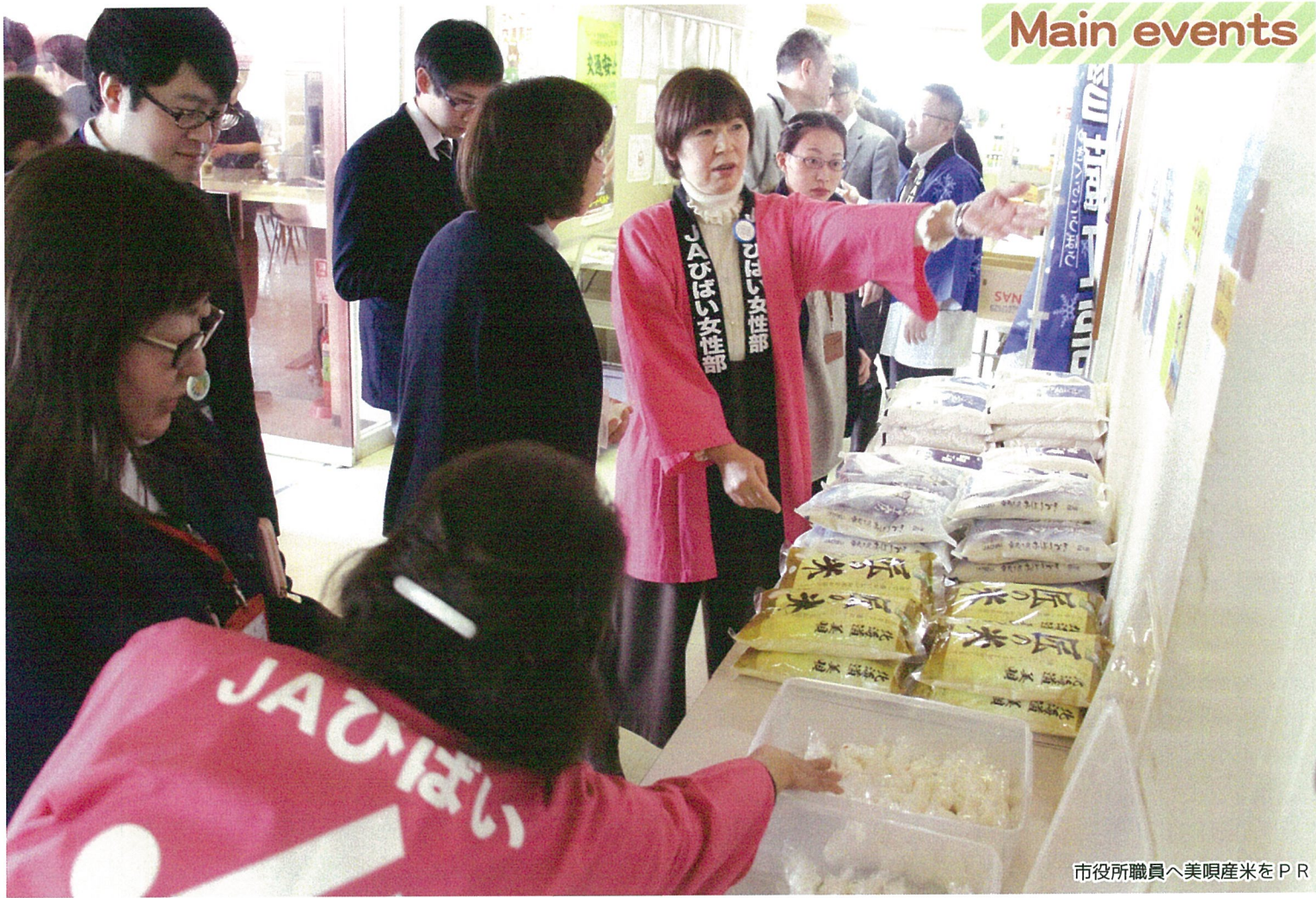
市役所職員へ美唄産米をPR