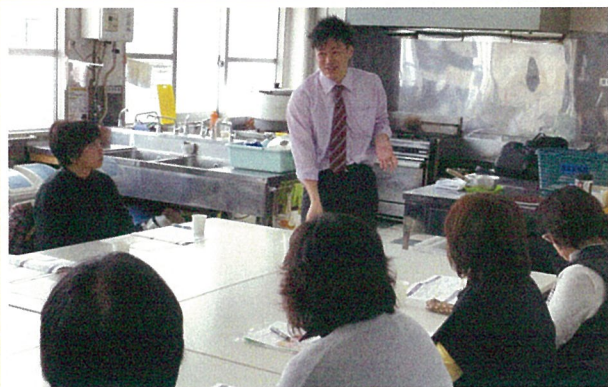
女性部加工部会が冬季講習をJA2階研修室で開催し、部会員11名が参加。岩見沢保健所の管理栄養士を講師に招き、食品衛生について学んだあとは、ゆへりん館で懇親会を開き、交流を深めた。(1/21)