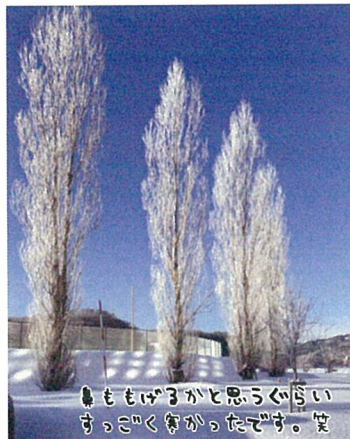
曇ももげると思ってたんですけど、笑