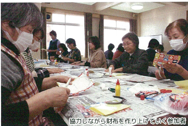
協力しながら財布を作り上げていく参加者

女性部では2017年度から料理サークルやパソコンサークルを開催。それぞれの趣旨に賛同した人たちが集い交流を深めており、手芸サークルの開催はこれが初めて。