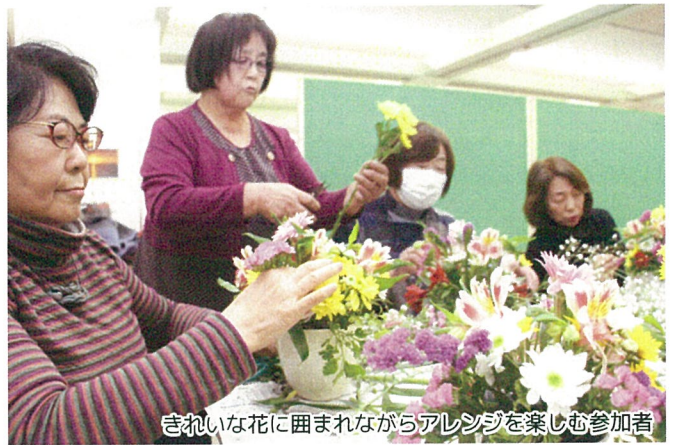
きれいな花に囲まれながらアレンジを楽しむ参加者

講座終了後は今年度の通常総会で議案提出する女性部の組織・活動内容の見直しについて参加者全員に説明がされた。