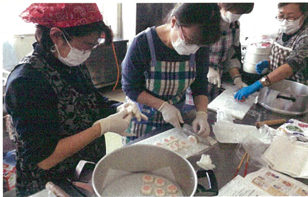
女性部が第8回目となる料理サークルをJA2階研修室で開催し、女性組合員9名が参加した。この日はだんご粉を使って富士山や花の形を作るデコ餅作りに挑戦した。(2/5)