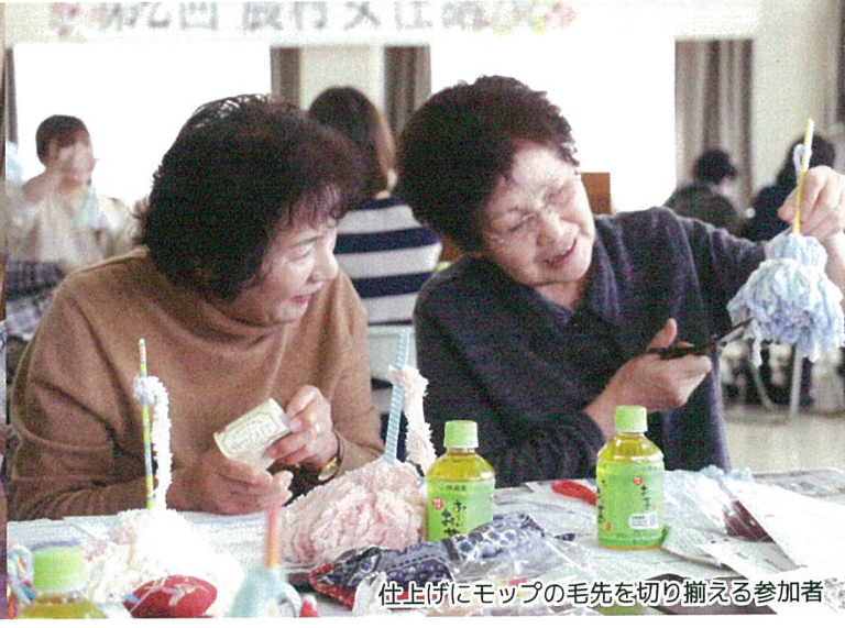
仕上げにモップの毛先を切り揃える参加者