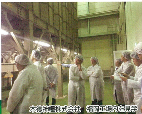
木徳神糧株式会社 福岡工場内を見学

木徳神糧株式会社は、1950年に設立されたコメ専門商社で、従業員数は268名、売上は約1,100億円を誇ります。木徳神糧グループは、国内市場における安定的な成長を維持しつつ、海外市場における市場創造も積極的に取り組んでいるとのこと。国内には、東京本社以外に5支店、4工場、海外には5社のグループ会社を有する大手企業です。同社では、北海道産米の取扱量も多くあるとのこと。今回訪問した九州支店では、九州地区の大学生協や7&Iグループ、吉野屋、吉野家などになつぽし等を納品しているとのことでした。