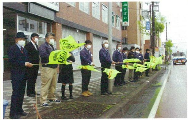
JAは美唄地区安全運転管理者協会などが実施する美唄安管セーフティ・チャレンジ 2020 に参加。職員ら 30 名が本所事務所前の国道 12 号線脇に立ち、旗を振って通行する自動車に安全運転を呼びかけた。(5/25 ~ 28)