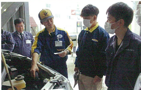
JAは職員向けの車両基本メンテナンス研修会をJA3階中会議室と給油所のピットで実施。JAの所有車を管理する 6 名が参加し、車両の基本的な点検や整備について学んだ。(5/27)