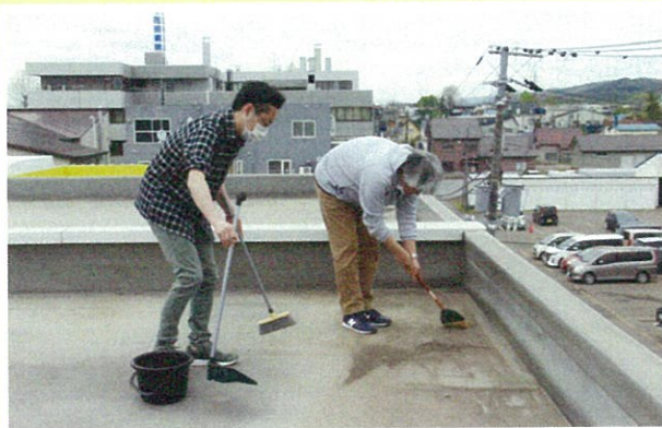
JAの職員組合が本所事務所の周辺清掃を実施。建物内の窓拭きや屋上の清掃、周辺のゴミ拾いなど清掃に勤しんだ。例年は活動終了後に懇親会を設けていたが、今年は新型コロナ感染対策のため自粛した。(5/23)