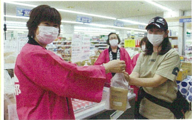
女性部三役はAコープコア店で市民支援活動を実施。新型コロナウイルス感染症による自粛で疲弊している市民に、米と牛乳をプレゼントした。女性部による市民支援活動はこれで 3 回目となる。(6/12)