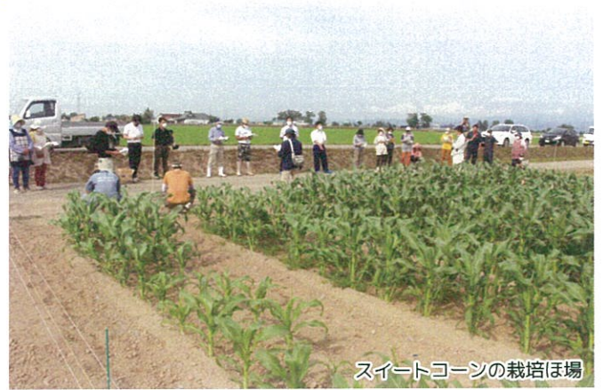
スイートコーンの栽培ほ場

女性部では新型コロナウイルスの影響により事業運営が計画通り実施できない状況となっているが、この活動は不定期で今後も実施する予定。