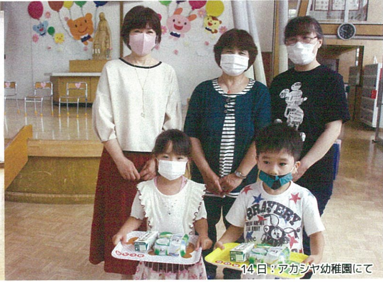
14日：アカシヤ幼稚園にて