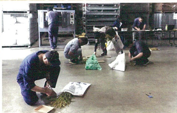
JA営農推進課がらいす工房で小麦の穂水分調査を実施。同JA管内の12の刈り取り組織が各ほ場の秋小麦を持ち寄り、穂の生重量と乾燥重を計算して穂水分が40%になる成熟期を予測した。(7/8～10)