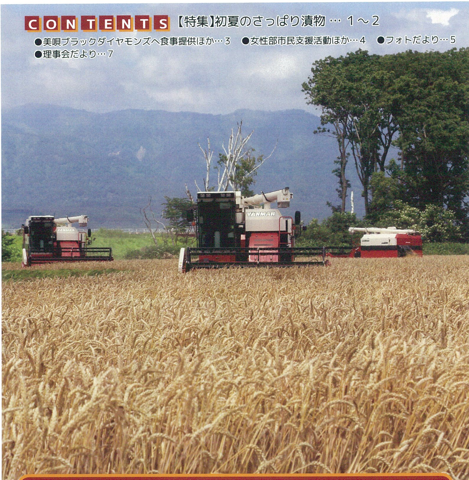
7/17 秋小麦収穫スタート（沼の内営農組合）