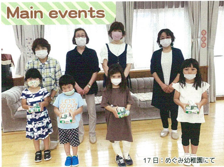
17日：めぐみ幼稚園にて